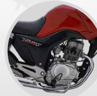
CHASIS MÁS LIGERO