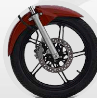
LLANTAS DE ALEACIÓN